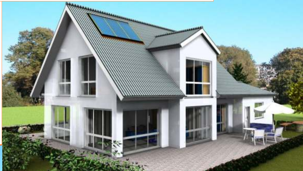
Ansicht der Terrassenseite (die Doppelgarage kann als Mehrleistung erworben werden)

Wohnfläche 143m 2 Außenmaße ca. 11,00m x 9,63m