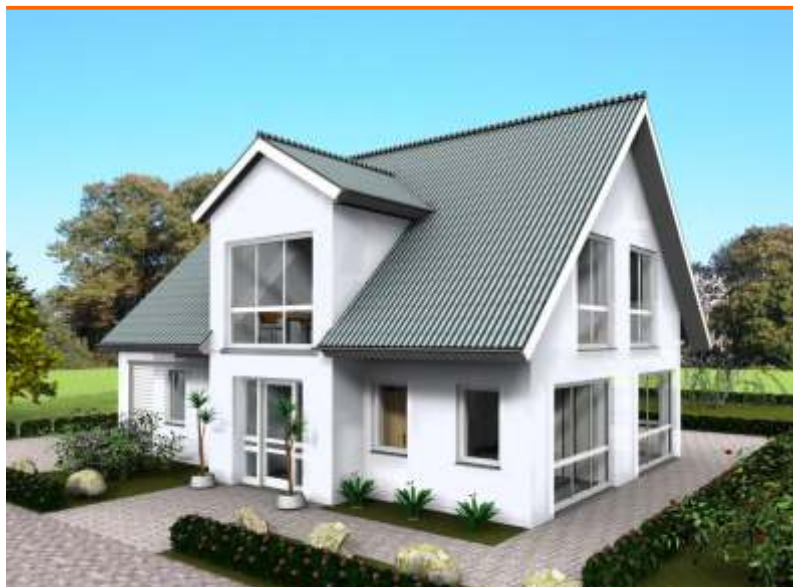
Ansicht der Eingangsseite