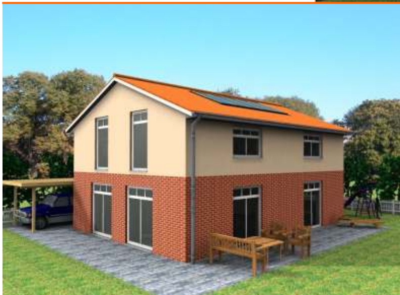
Ansicht der Terrassenseite