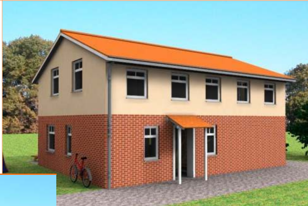
Ansicht der Eingangsseite

Wohnfläche 133m 2 Außenmaße ca. 11,125m x 8,00m