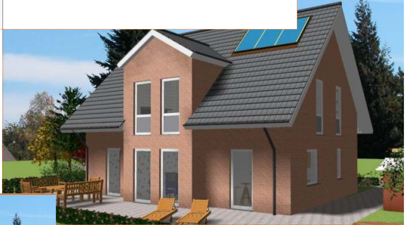
Ansicht der Terrassenseite