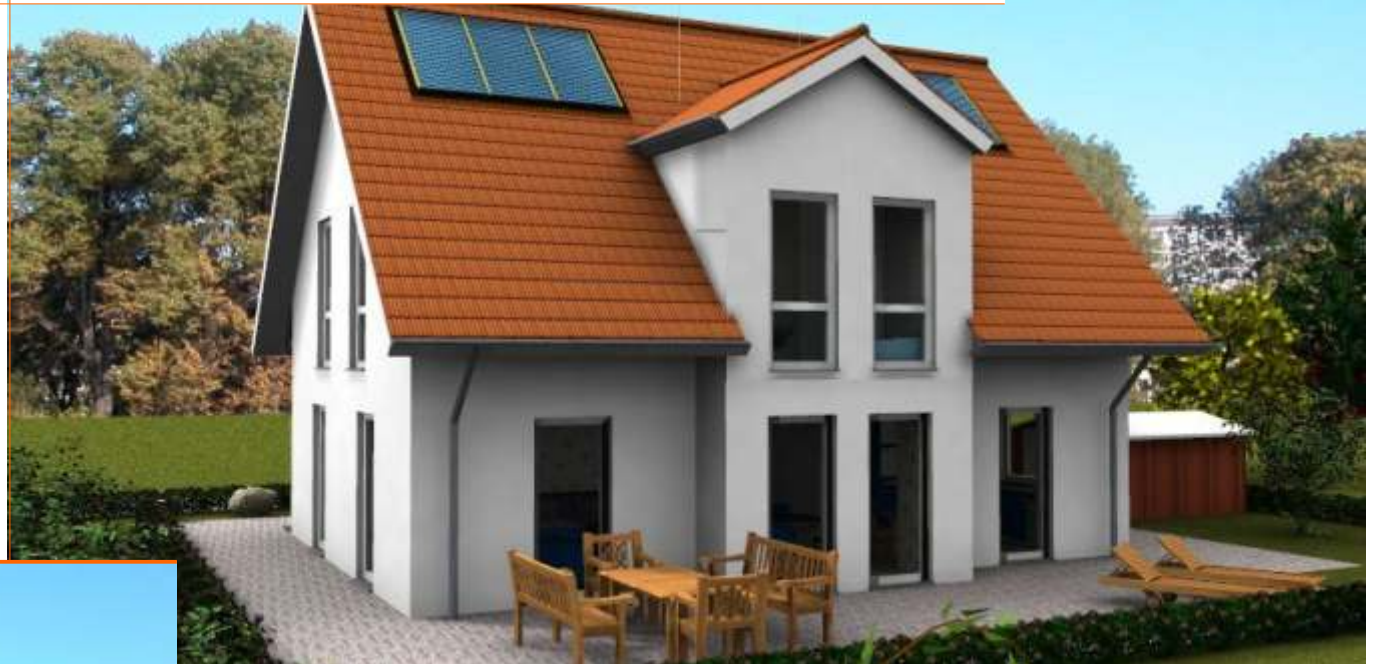
Ansicht der Terrassenseite

Wohnfläche 142m 2 Außenmaße ca. 11,00m x 9,63m