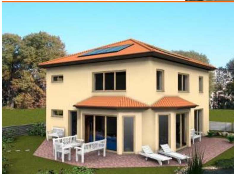
Terrassenansicht mit den zwei großen Erkern