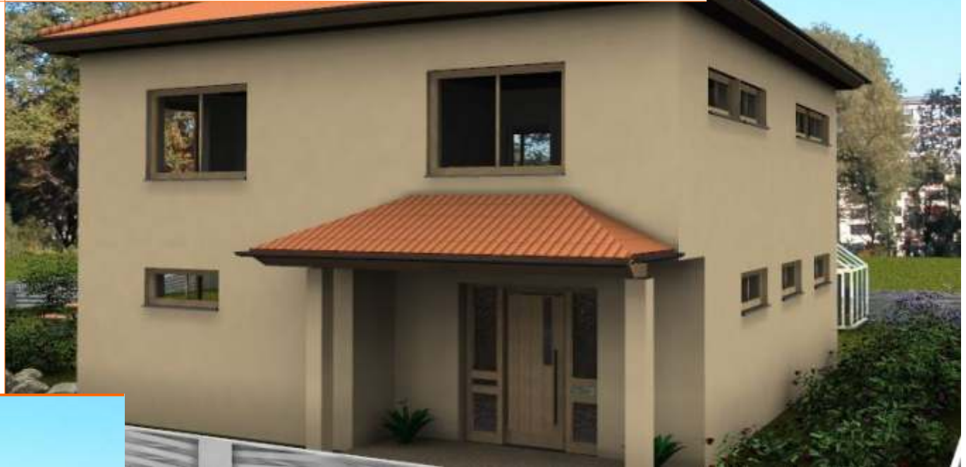
Ansicht der Eingangsseite mit überdachtem Eingang

Wohnfläche 158m 2 Außenmaße ca. 10,80m x 11,82m