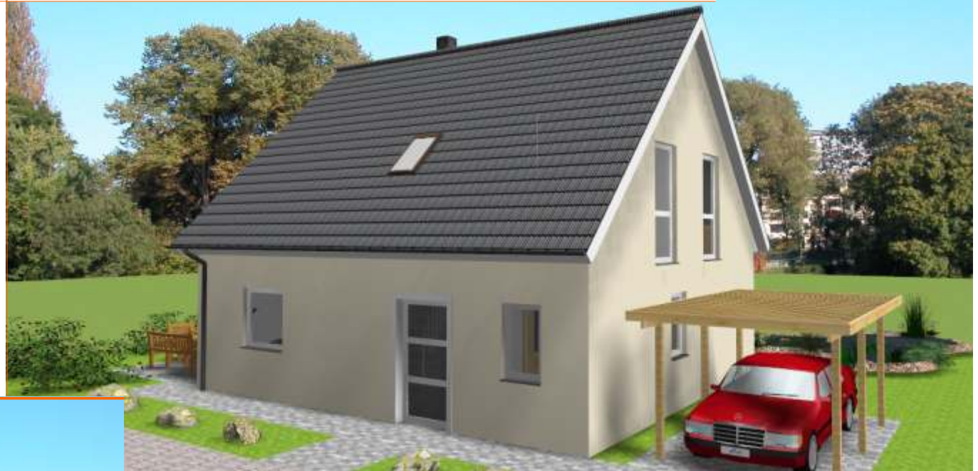
Ansicht der Eingangsseite

Wohnfläche 120m 2 Außenmaße ca. 9,85m x 8,35m