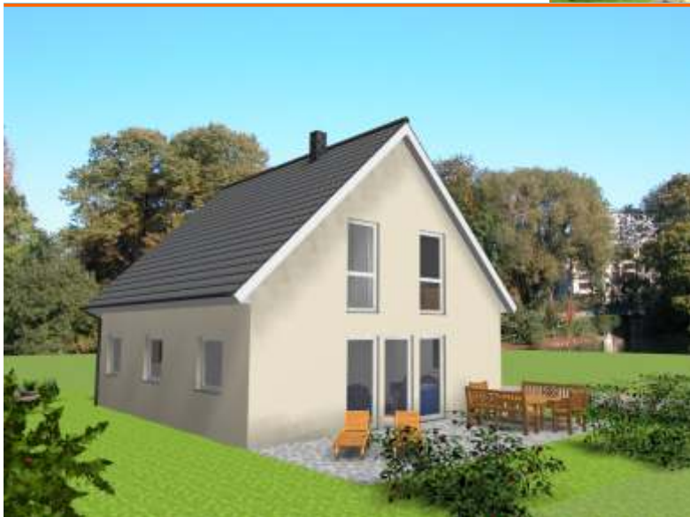
Blick auf die Terrasse