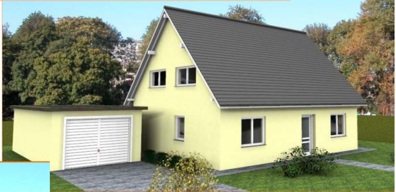
Ansicht der Eingangsseite

Wohnfläche 128m 2 Außenmaße ca. 9,10m x 10,35m