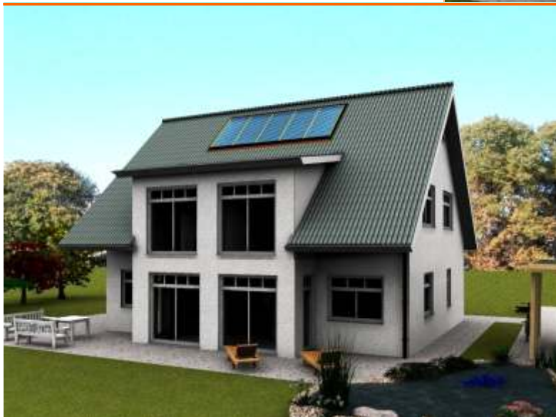
Blick auf die Terrasse