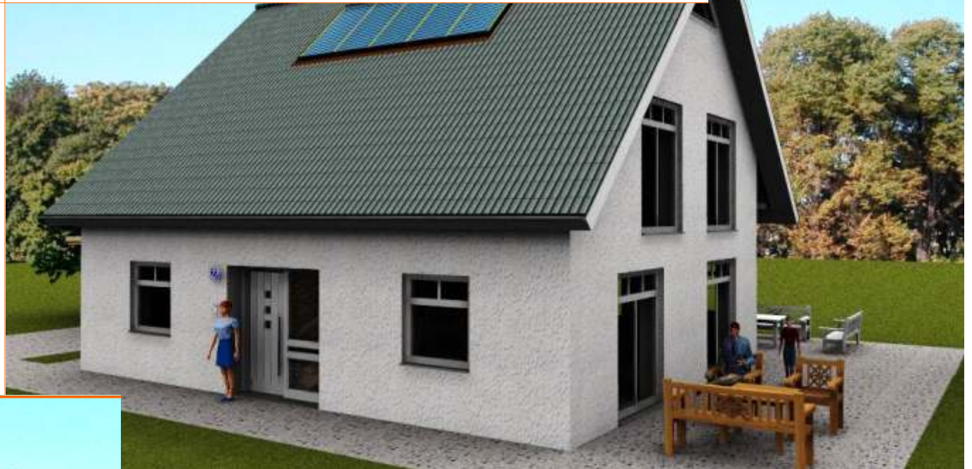
Ansicht der Eingangsseite