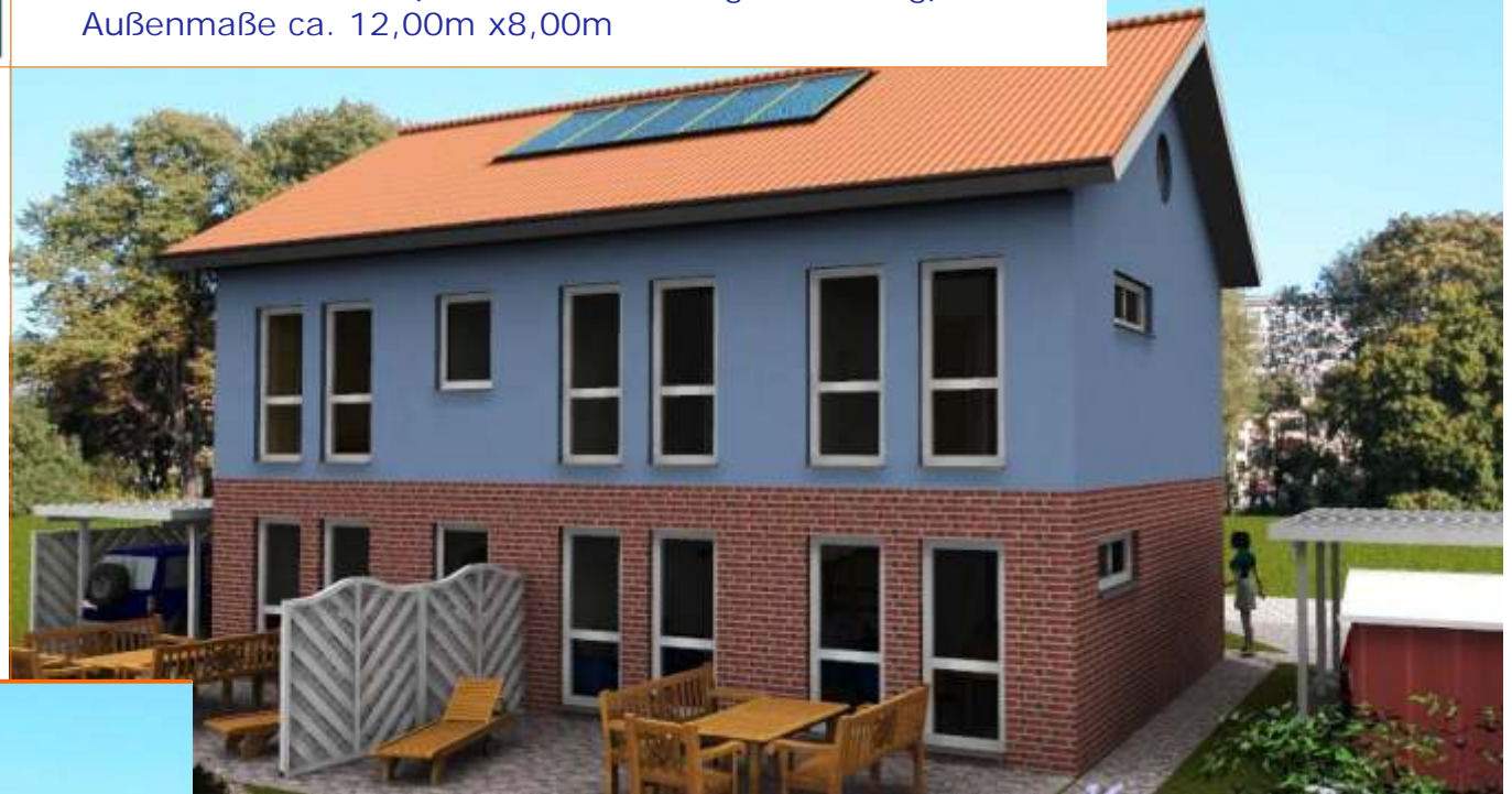
Ansicht der Terrassenseite

Wohnfläche 152m 2 (davon 42m 2 Einliegerwohnung) Außenmaße ca. 12,00m x 8,00m