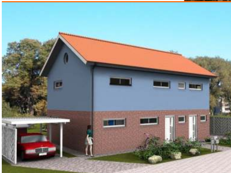
Blick auf die Eingangsseite