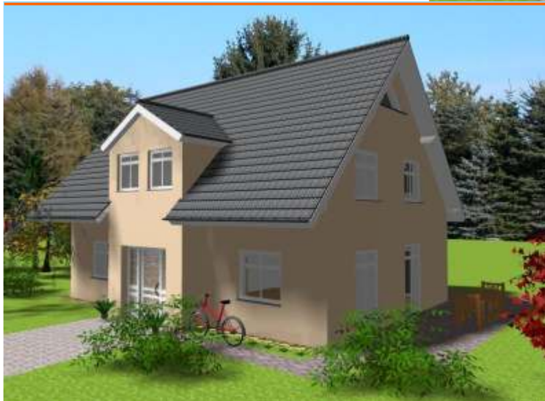
Ansicht der Eingangsseite