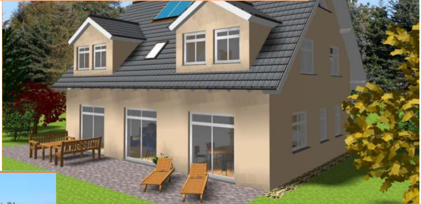
Ansicht der Terrassenseite

Wohnfläche 152m 2 Außenmaße ca. 11,50m x 9,50m