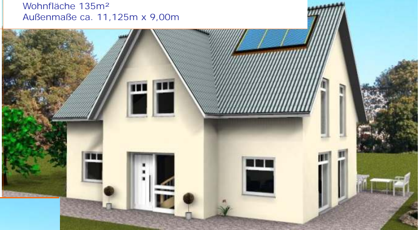
Ansicht der Eingangsseite