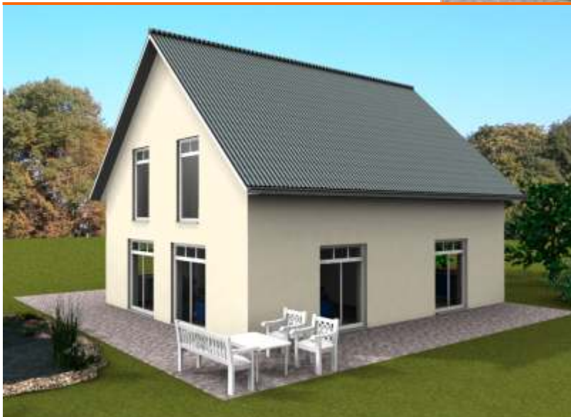
Ansicht der Terrassenseite