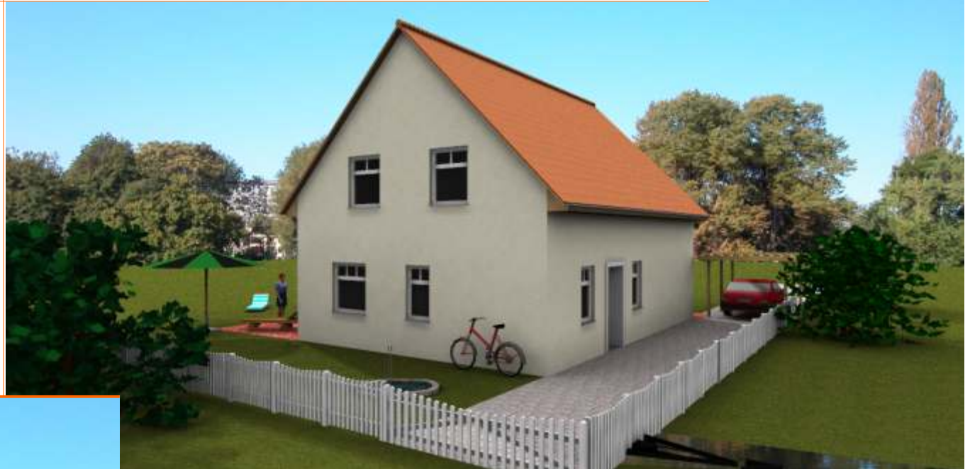
Ansicht der Eingangsseite

Wohnfläche 126m 2 Außenmaße ca. 11,125m x 8,00m